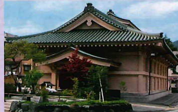
山中温泉 菊の湯 (男湯)