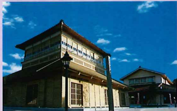
山代温泉 総湯・古総湯